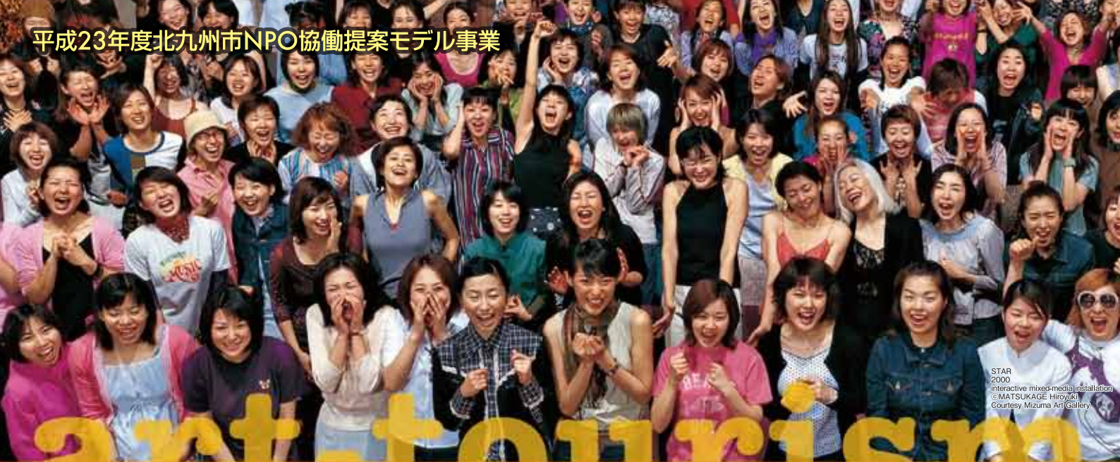
STAR 2000 interactive mixed-media installation © MATSUKAGE Hiroyuki Courtesy Mizuma Art Gallery