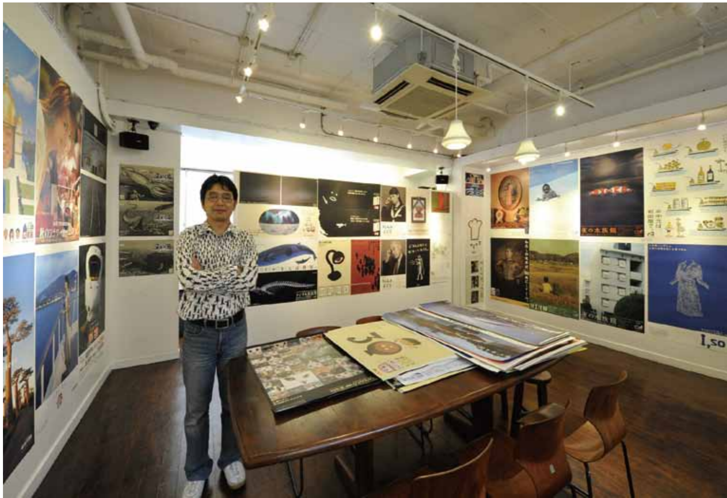
2011年5月ギャラリールモ 広告ポスター展