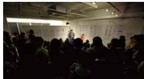
2009年5月ギャラリールモ ロゴ屋展 講演会

●プロフィール/1967年大分県生まれ、88年九州デザイナー学院、88年アンテナグラフィックアーツ、92年(株)仲畑広告制作所、96年(株)広告研究所、05年1月独立カジグラ開業、07年10月株式会社カジグラ代表取締役。2月本社平尾浄水町に移転。 ●所属団体/九州アートディレクターズクラブ(K-adc)、九州会、九州宣伝会議講師●受賞歴/97年朝日広告賞01年福岡広告協会賞大賞、02年広告電通賞金賞、03年福岡広告協会賞銀賞、04年福岡広告協会賞銀賞、05年福岡広告協会賞、銅賞06年福岡広告協会賞銀賞、06年ACC賞ゴールド賞