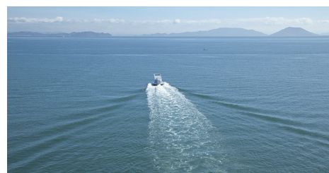
ファスナーの船 (2010年)