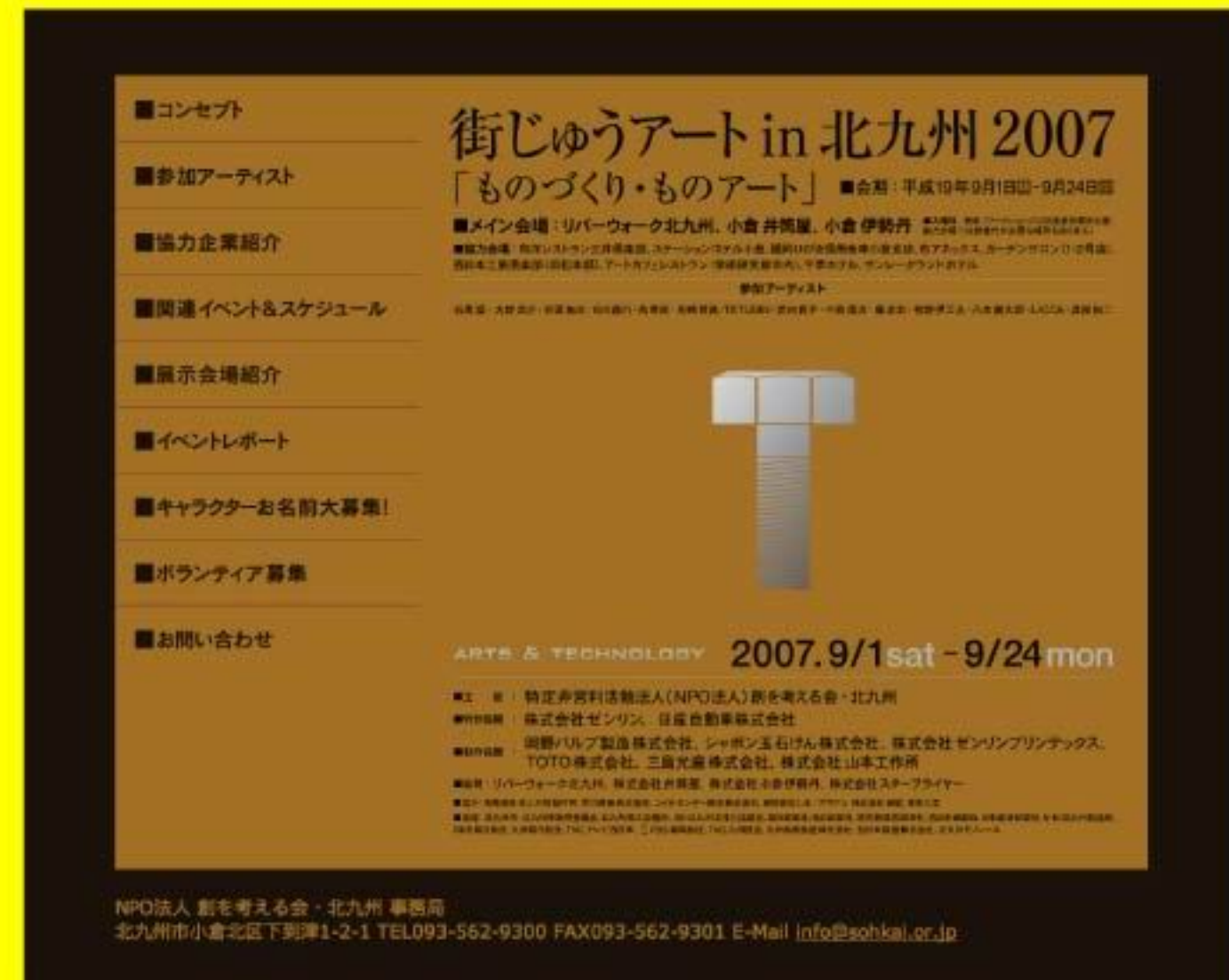
■ 特設サイト: www.sohkai.or.jp/mjart/index.html